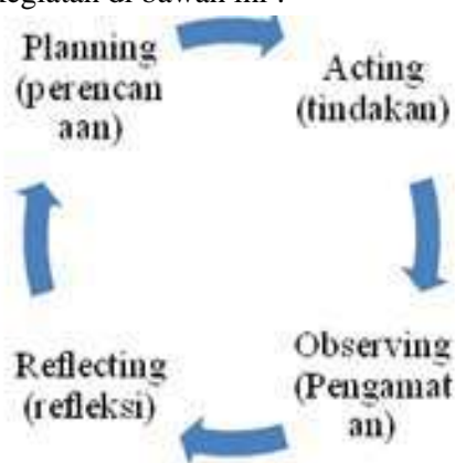
Gambar 2. Siklus Menurut Kurt Lewin (Arikunto, 2007 : 20)

Tujuan utama PTK adalah untuk memecahkan permasalahan nyata yang terjadi di dalam kelas. Kegiatan penelitian ini tidak saja bertujuan untuk memecahkan masalah, tetapi sekaligus mencari jawaban ilmiah mengapa hal itu dapat di pecahkan dengan tindakan yang dilakukan. Desain yang digunakan dalam penelitian ini adalah yang dikembangkan oleh Kurt Lewin (Arikunto, 2007 : 20) didasarkan atas pokok bahwa penelitian tindakan terdiri dari empat komponen pokok yang juga menunjukkan langkah yaitu: (a) Planning (perencanaan), (b) Acting (tindakan/pelaksanaan), (c) Observing (observasi), (d) Reflecting (refleksi). Hal ini dapat kita lihat dari bagan siklus kegiatan di bawah ini :