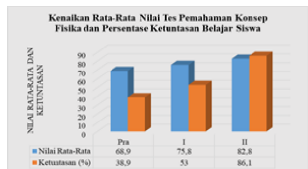
Gambar 3. Grafik Kenaikan Nilai Tes Pemahaman Konsep Fisika dan Persentase Ketuntasan Belajar Siswa