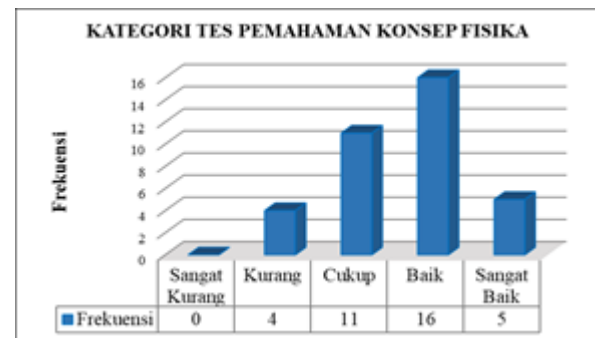
Gambar 2. Diagram Hasil Tes Pemahaman Konsep Fisika Siklus I

Untuk kejelasan deskripsi hasil tes pemahaman konsep fisika siswa kelas X MIA-1 SMA Negeri 3 Sibolga setelah dilakukan tindakan, maka disajikan dalam bentuk diagram berikut ini: