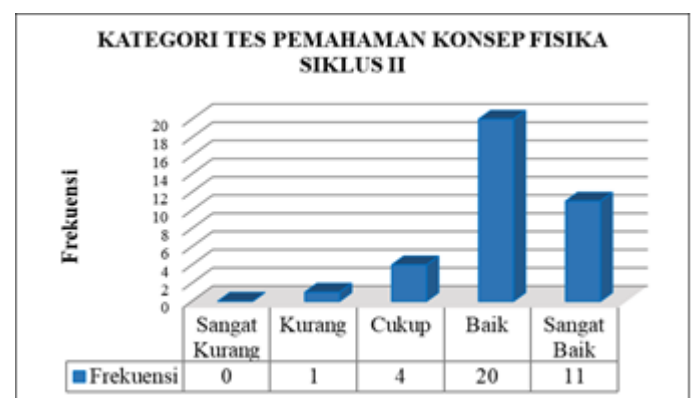
Gambar 2. Diagram Hasil Tes Pemahaman Konsep Fisika Siklus II

Untuk kejelasan deskripsi hasil tes pemahaman konsep fisika siswa kelas X MIA-1 SMA Negeri 3 Sibolga setelah dilakukan tindakan, maka disajikan dalam bentuk diagram berikut ini: