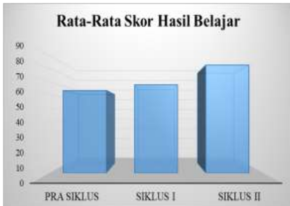
Gambar 4. Rata Rata Perolehan Skor Hasil Belajar

demikian penerapan metode imager streaming membantu meningkatkan kemampuan siswa menulis cerpen siswa kelas X IIS-3 SMA Negeri 3 Sibolga. Peningkatan rata-rata skor hasil tes ditampilkan pada gambar 4 berikut ini.