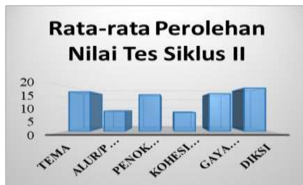
Gambar 3. Rata-rata Perolehan Nilai Siswa Tes Siklus II

Ketidakhadiran perilaku peneliti yang diharapkan pada siklus I tersebut berdampak pada minimalnya kemampuan belajar siswa pada kelas X IIS-3. Walaupun hasil tes I meningkat dari tes awal pada aspek tema, alur kohesi/koherensi dan diksi. Berdasarkan kenyataan di atas maka diperlukan kelanjutan siklus II untuk mengatasi hal tersebut. Hasil refleksi pada siklus I dapat dilihat pada gambar 3 di bawah ini.