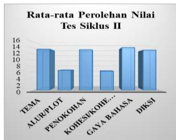
Gambar 2. Rata-rata Perolehan Nilai Siswa Tes Siklus I

Sesuai dengan hasil tes awal yang telah dilakukan, maka diberikan tindakan dengan menerapkan metode image streaming (mengalirkan bayangan) untuk meningkatkan kemampuan menulis cerpen remaja siswa, maka datanya dapat dilihat pada gambar di bawah ini.